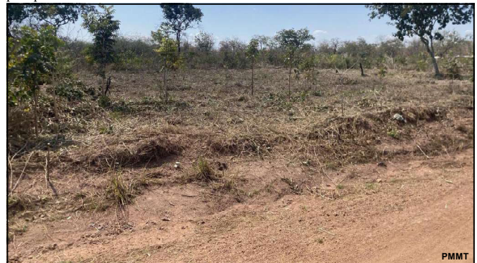
Área de reserva ambiental

A sociedade pode contribuir com as ações da Polícia Militar de qualquer cidade do Estado, sem precisar se identificar, por meio do 190 ou 0800.065.3939.