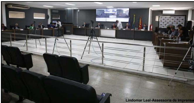
Sessão de segunda-feira