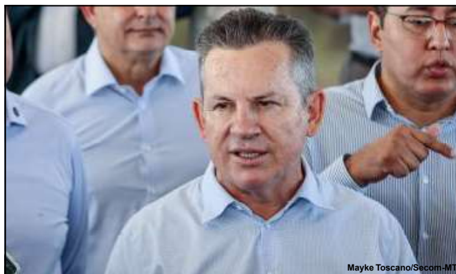
Mauro Mendes reitera apoio a Bolsonaro

Mendes não foi o único governador a estar ausente. Em São Paulo, Tarcísio de Freitas (Republicanos) também não compareceu. Cláudio Castro (PL-RJ) foi o único governador a ir aos atos, o que gerou dúvidas dos bolsonaristas quanto ao apoio dos chefes dos executivos estaduais.