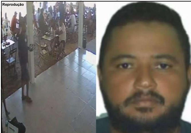
Vítima tinha medida protetiva