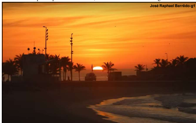
José Raphael Berrêdo-01

Cuiabá (MT) tem previsão de chegar aos 40 °C no pico do fenômeno, enquanto São Paulo (SP) e Belo Horizonte (MG) devem registrar tardes acima dos 30 °C.