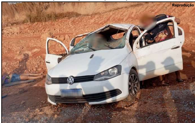
Acidente na serrinha

Ainda não há informações sobre o que teria provocado o acidente.