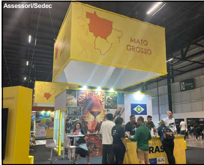
O evento permitiu que municípios apresentassem seus atrativos, empresas ampliassem suas redes de clientes

Estande de Mato Grosso no evento permitiu não apenas mostrar a gastronomia e cultura do Estado, mas promover ambiente de negócios