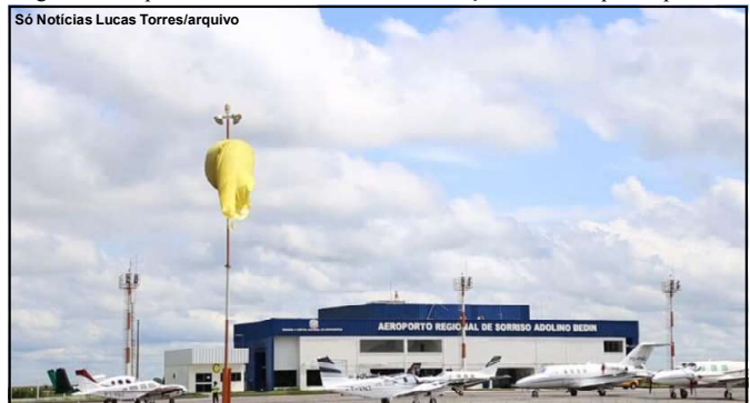
Sinfra promove encontro em Sorriso

A sessão tem início previsto para as 9h e será transmitida ao vivo pelos canais oficiais da Câmara Municipal.