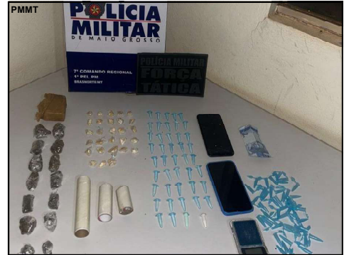
Força Tática em ação permanente

Os policiais iniciaram as buscas na casa e localizaram todo o restante dos entorpecentes, balança de precisão,