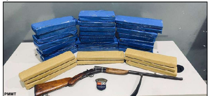
Tráfico e porte ilegal de arma de fogo

A sociedade pode contribuir com as ações da Polícia Militar de qualquer cidade do Estado, sem precisar se identificar, por meio do 190 ou 0800.065.3939.