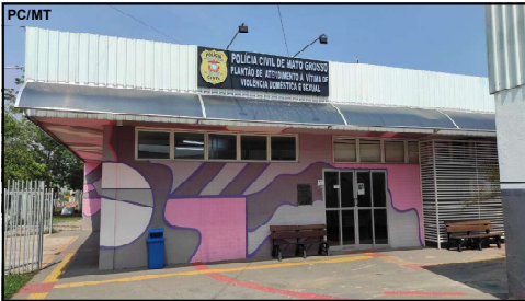
Vítimas de Violência Doméstica

Unidade da Polícia Civil também elaborou 2 mil boletins de ocorrência no mesmo período