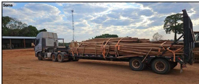
Carga de madeira foi doada a Prefeitura Municipal de Nova Bandeirantes

Quem se deparar com um crime ambiental também pode denunciar à Polícia Militar, pelo 190.