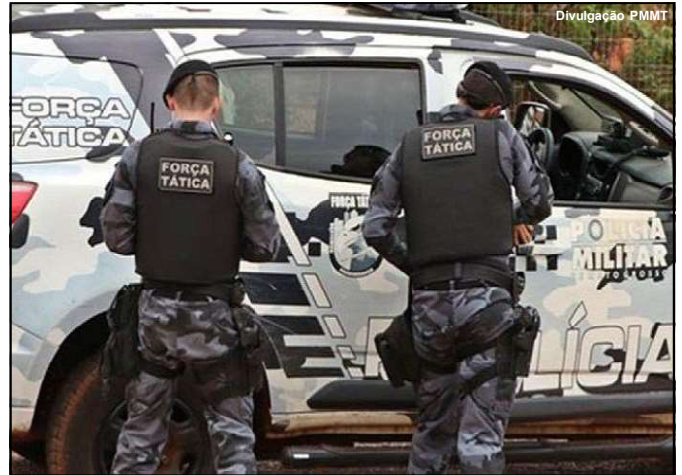
Perseguição iniciou na Av. Jaime Campos