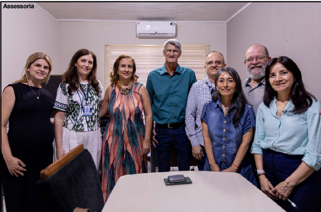
Prefeito com equipe da saúde do município de AF

Para Alta Floresta, a participação no projeto representa um marco importante no fortalecimento da rede de saúde bucal e no acesso da população a um atendimento cada vez mais qualificado, moderno e conectado às novas tecnologias.