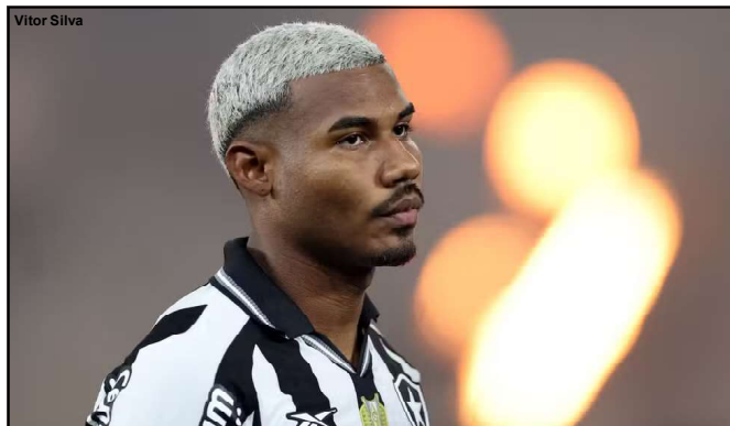
Cuiabano retorna ao Botafogo por empréstimo

Muitos torcedores do Nottingham Forest questionaram a janela de transferências do clube inglês com a compra de quatro jogadores do Botafogo em curto espaço de tempo. Depois do empréstimo de Cuiabano ao Botafogo os questionamentos aumentaram nas redes sociais do clube.