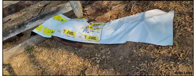
Idoso foi encontrado sem vida após vários dias desaparecido

O caso será investigado pela Polícia Civil.