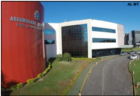
Assembleia Legislativa do Estado de Mato Grosso